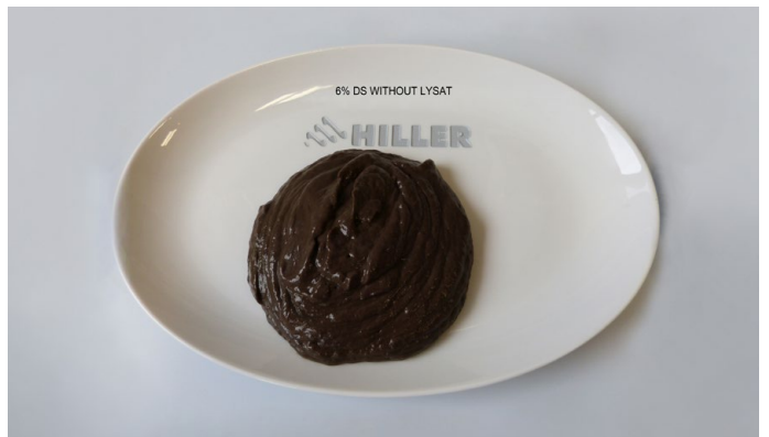
6 % DS without lysat