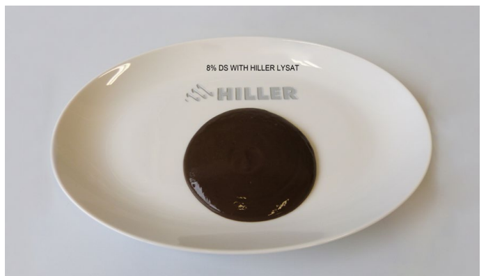
8 % DS with HILLER lysat

Отсканируйте код и убедитесь в этом в видеоролике: