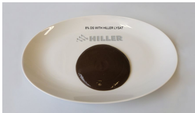
8 % DS with HILLER lysat