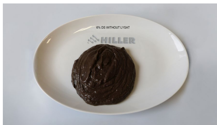
6 % DS without lysat

HILLER GmbH può dimostrare tramite proprie referenze uno specifico vantaggio d'esperienza come produttore di centrifughe ad alte prestazioni in questo segmento applicativo. Il know-how costruttivo e procedurale è saldamente ancorato all'azienda.